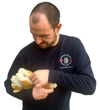
Herz-Druck-Massage beim kleinen Hund