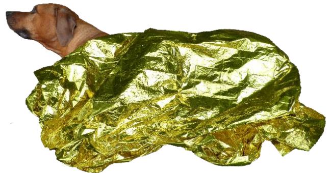
Lagerung bei Bewusstlosigkeit