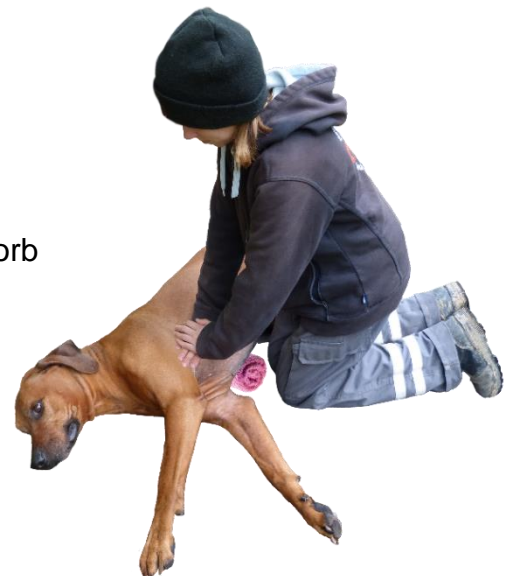
Herz-Druck-Massage beim großen Hund